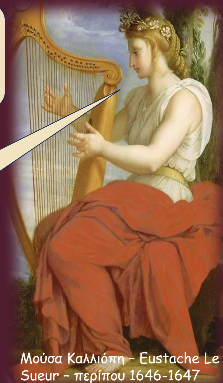
Μούσα Καλλιόπη - Eustache Le Sueur - περίπου 1646-1647

Ακριβώς, Ομηρούλη μου! Μπράβο! Κράτησες καλές σημειώσεις!