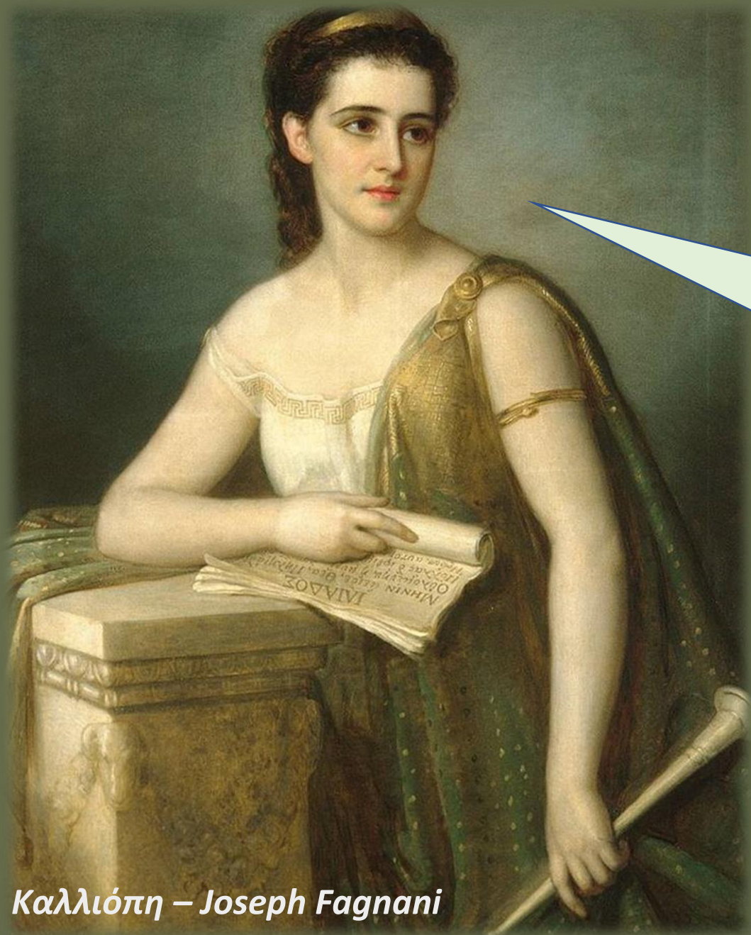
Καλλιόπη – Joseph Fagnani 1859

Αγαπητοί φίλοι, γεια σας! Είμαι η Μούσα Καλλιόπη και, συνεπής στο ραντεβού μας, είμαι έτοιμη να σας παρουσιάσω το δεύτερο επεισόδιο της συναρπαστικής μας σειράς! Πού ακριβώς είχαμε μείνει, Όμηρε;