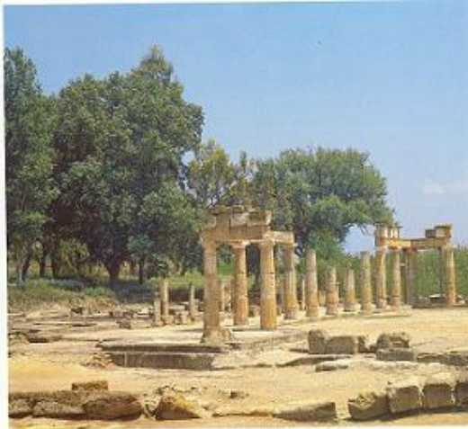
Η στοά των άρκτων στον ιερό ναό της Βραυρωνίας Αρτέμιδος