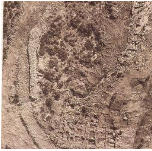
Ζάγανι: Αεροφωτογραφία του οικισμού