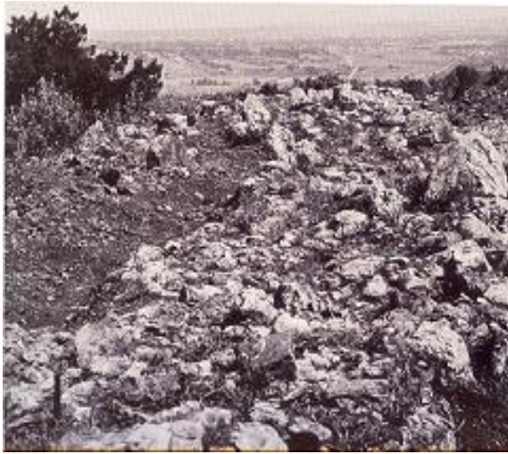
Ζάγανι: Τμήμα του Πρωτοελλαδικού οχυρωματικού τείχους

οχές και υπάρχει κεντρική οδός που στις δύο πλευρές της υπάρχουν τα υπολείμματα απλών σπιτιών. Φαίνεται ότι η ακρόπολη του Ζάγανι έλεγχε τους δρόμους της πεδιάδας προς τη Λούτσα κυρίως.