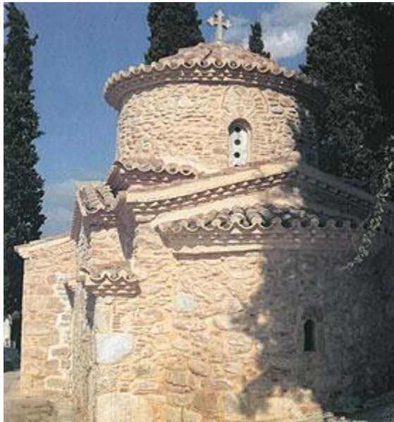
Ναός του Αγίου Δημητρίου

στροφές και γενικά πολύ περιορισμένα οικονομικά και πολιτιστικά μέσα.