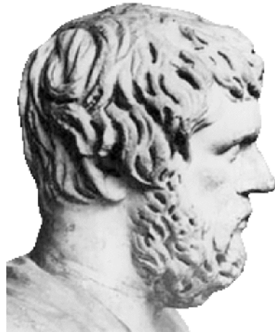
Προτομή του Ξενοφώντα

Κάτω από τη Ρωμαϊκή κατοχή η περιοχή χάνει βέβαια την ελευθερία της αλλά όχι την οικονομική της ευρωστία. Μεγάλα αγροκτήματα της Ρωμαϊκής εποχής που έχουν ανακαλυφθεί στην περιοχή του αεροδρομίου δείχνουν αυτόν τον πλούτο και την οικονομική δύναμη. Τα ιερά συνεχίζουν να έχουν δύναμη και πιστούς και η περιοχή εκτός από τις αγροτικές καλλιέργειες γίνεται και τόπος εξοχής για τους πλούσιους Ρωμαίους π.χ. το αγρόκτημα του Ηρώδη του Αττικού στο Μαραθώνα.