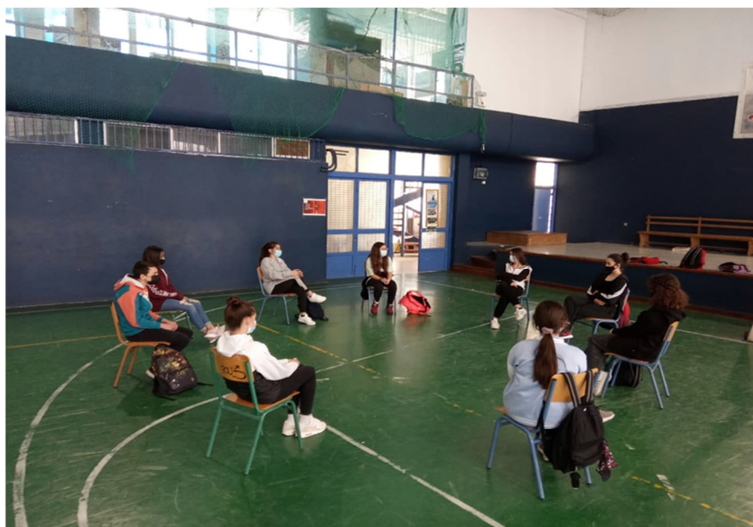
Εκπαίδευση στη σχολική διαμεσολάβηση

Η εκπαίδευσή τους σε τεχνικές και δεξιότητες επικοινωνίας είναι κυρίως βιωματική, με θεωρητική υποστήριξη περιλαμβάνει στοιχεία μεθοδολογίας από τη συνθετική συμβουλευτική ψυχολογία και συνοδεύεται από πρακτική εφαρμογή και ανάληψη πραγματικών περιστατικών